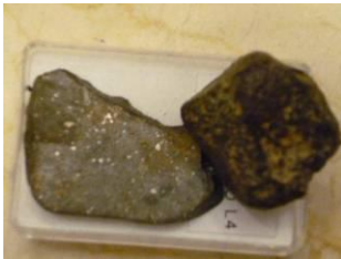
Lititos: Condrita y Acondrita

Hay tres tipos principales de meteoritos Aerolitos, formados principalmente de roca. Los Sideritos en los que predomina el hierro y el níquel y los Siderolitos , que son una mezcla de hierro y roca. Si queremos ser buscadores de meteoritos debemos empezar por los Sideritos . Los Aerolitos se dividen en Condritas y Acondritas y estos últimos al ser rocosos son difíciles de identificar. Son como una piedrecita o roca más a los ojos de personas no expertas. Las Concritas contienen hierro y níquel en pequeñas proporciones y de su composición se establece una larga clasificación.