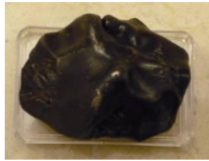
Siderito: (Hierro y Níquel)