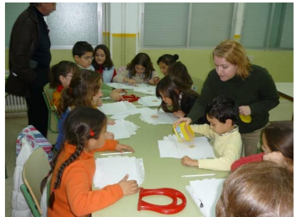
Figura 2: Niños haciendo experimento