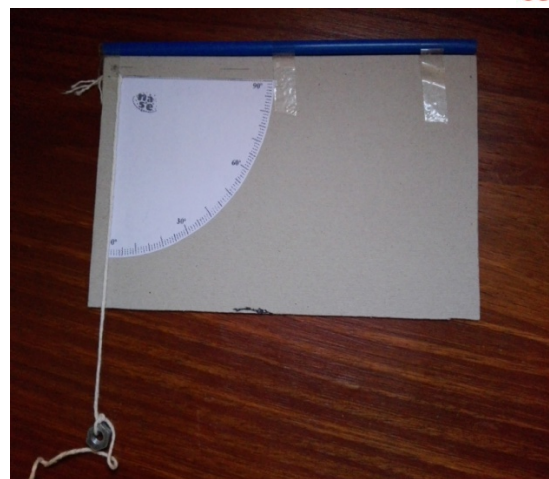
Figura 2: cuadrante

Para obtener el ángulo respecto del horizonte del observador se debe mirar por la pajita el punto más alto del objeto a medir, dejar que el peso quede en reposo y rotar 90° el cuadrante para que la cuerda indique el ángulo medido.