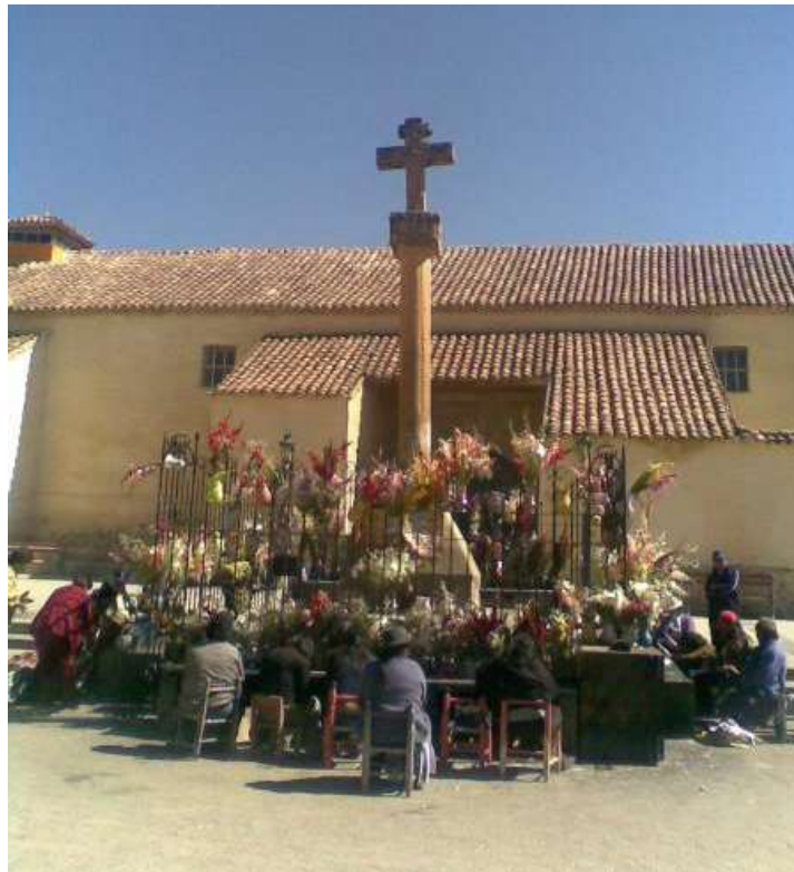
Figura 1 : Cruz de Chongos, lugar donde actualmente los pobladores van a pedir o agradecer por algún milagro.

La llegada de los Españoles al Imperio Inca marca un cambio radical en las costumbres de los habitantes, uno de los principales objetivos de los Españoles, fue la de implantar la religión Católica y para ello la construcción de iglesias fue inminente. En la localidad de Chongos Bajo a 10 km al SO de la Ciudad de Huancayo está la Iglesia de la Cruz de Chongos, una de las primeras iglesias establecida por los colonizadores en el Valle del Mantaro, hoy una iglesia muy concurrida por fervientes creyentes ya que la Cruz de Chongos se dice que fue traída desde España, tallada en piedra.