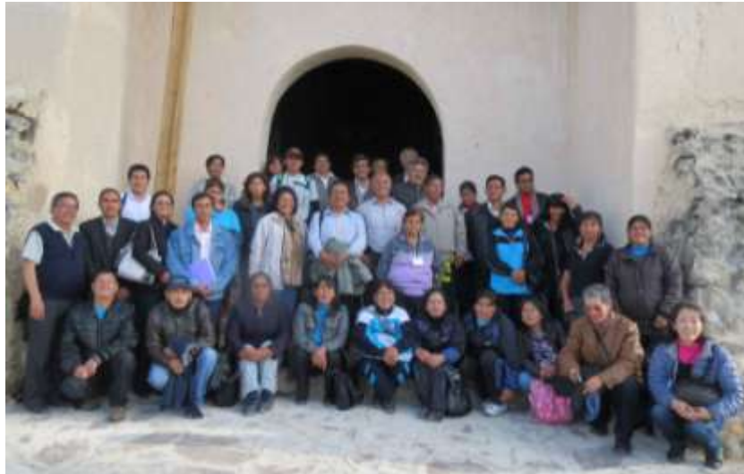
Figura 5 : Participantes al Taller NASE 2015 frente a la Capilla de Porcónn

Se requieren de mayores investigaciones, pero con herramientas simples como el Google Earth y una brújula, se puede iniciar un trabajo de investigación en arqueoastronomía.