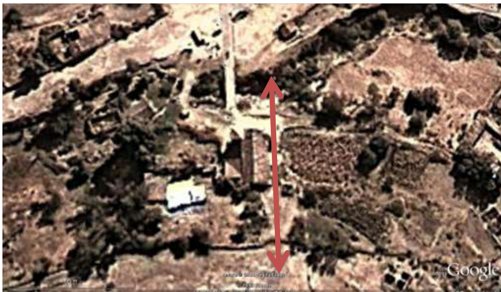
Figura 3 : Orientación de la Capilla de Porcón. Hacia el norte la Cruz de la Inquisición.